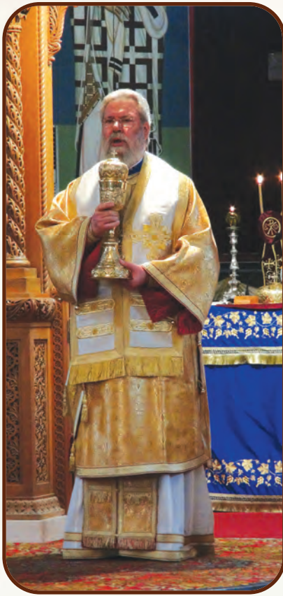
Ὁ Ἀρχιεπίσκοπος Χρυσόστομος Β' Λειτουργῶν

στηκε τὸ Εὐαγγέλιο τοῦ Χριστοῦ, τὸν πρῶτο καὶ καθοριστικὸ ρόλο στὴ ζωὴ τῆς τὸν ἔχει ἡ Ἐκκλησία τῆς Ἀποστολικῆς ἡ Ἐκκλησίας μας, ἀλλὰ καὶ ἑλληνικὰ τὰ βήματα τῶν προγόνων. Ποιὸ νὰ ἴκουε πρῶτα ὁ Μακαριώτατος; Τὸν Βαρνάβα, τὸν Παῦλο, τὸν Εὐαγόρα, τοὺς αἰῶνες; Ἑλλη-