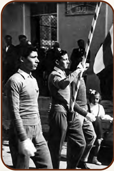
Μαθητὴς τοῦ Γυμνασίου Πάφου (πρῶτος ἀπὸ ἀριστερά)

«θερμὸν ἀντιλήπτορα καὶ εὐεργέτην καὶ φύλακα, τοὺς αἰχμαλώτους ρυόμενον».