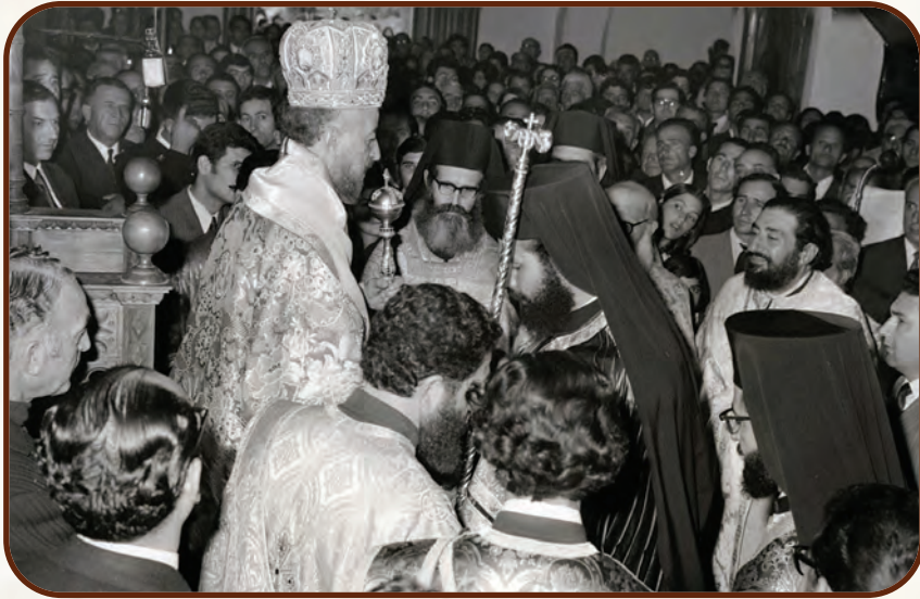
Κατὰ τὴν ἐνθρόνισή του ὡς Ἡγουμένου τῆς Ἱερᾶς Μονῆς Ἁγίου Νεοφύτου ἀπὸ τὸν Ἀρχιεπίσκοπο Μακάριο Γ΄

του. Ἀνεδείχθη, κατὰ τὸν Εὐαγγελιστὴν, «ὁ λύχνος ὁ καίμενος καὶ φαίνων» (Ἰω. ε΄, 35) στὸ μέσον τῶν πιστῶν, ὀδηγώντας τους.