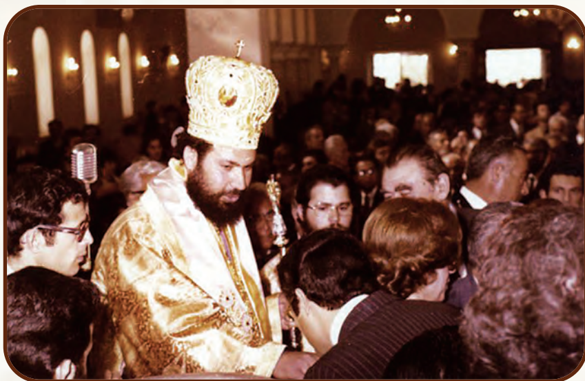
Κατὰ τὴ χειροτονία του ὡς Μητροπολίτου Πάφου

ἀκόμα καὶ κυβερνητικὲς ἀποφάσεις, ἔχοντας τὴ σφραγίδα τοῦ ἴδιου τοῦ Ἐθνάρχου Μακαρίου καὶ τῶν τοπικῶν ἀρχόντων, μποροῦν νὰ ἀκυρωθοῦν, φτάνει νὰ ὑπάρχει ὁ ἰθύνων νοῦς ποὺ μὲ τὴ δυναμικότητά του νὰ ἐπεμβαίνει στὰ πράγματα γιὰ τὸ μακροπρόθεσμο καλὸ τῆς κοινωνίας. Στὸν Μακαριώτατο ὀφείλεται ἡ ἀκύρωση τῆς ἀπόφασης γιὰ δημιουργία λιμανιοῦ στὴν Πάφο καὶ ἡ δημιουργία, ἀντ' αὐτοῦ, τοῦ ἀεροδρομίου. Τὰ πλεονεκτήματα εἶναι σήμερα ἔκδηλα στὸν καθένα.