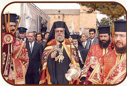
Μετά την ἐνθρόνισή του ὡς Ἀρχιεπισκόπου Κύπρου, πορευόμενος πρὸς τὸ Μέγα Συνοδικὸ τῆς Ἱερᾶς Ἀρχιεπισκοπῆς

τὸ μέγεθος τῆς μαρτυρίας της, ἀπὸ τὴν ποιότητα τῶν θεσμῶν καὶ τοῦ διακονήματός της. Τὸ νέφος τῶν Μαρτύρων καὶ τῶν Ἁγίων τῆς Ἐκκλησίας τῆς Κύπρου κανένας δὲν μποροῦσε νὰ τὸ ἀρνηθεῖ. Οὔτε καὶ τὴν Ἀποστολικότητά της. Καὶ ἡ μαρτυρία της ἀδιαμφισβήτητη. Παροῦσα σ' ὅλες τὶς Οἰκουμενικὲς Συνόδους. Ποταμοὶ τὰ αἵματα γιὰ τὴ διατήρηση τῆς Ὁρθοδοξίας τῆς ἀπέναντι σὲ ἀλλόθρησκους καὶ ἑτερόδοξους κατακτητές. Ὑστεροῦσε, ὅμως, στὴ διοικητικὴ διάρθρωση καὶ τοὺς θεσμούς. Ἀπὸ τὰ τέλη τοῦ 12ου αἰώνα οἱ Λατίνοι ἐξάρθρωσαν τὴ διοικητικὴ ὀργάνωσή της, ὁρατὸ σημεῖο τῆς Αὐτοκεφαλίας της. Καὶ ἐνωθε