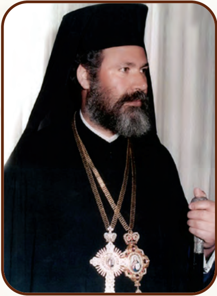
Ὡς Μητροπολίτης Πάφου

ταγωνιστεί σ' ὄλες τὶς ἐκφάνσεις τῆς ζωῆς τοῦ ποιμνίου τῆς, διακήρυττε σ' ἓνα συνέδριο τῶν ἀποδήμων: «Δὲν χαρίζουμε σὲ κανένα τὸ ἀκριβό μας προνόμιο νὰ ἔχουμε ἄποψη ἐπὶ τῶν καιριοτέρων ζητημάτων τοῦ τόπου καὶ νὰ τὴν ἐκθέτουμε ἐλεύθερα».