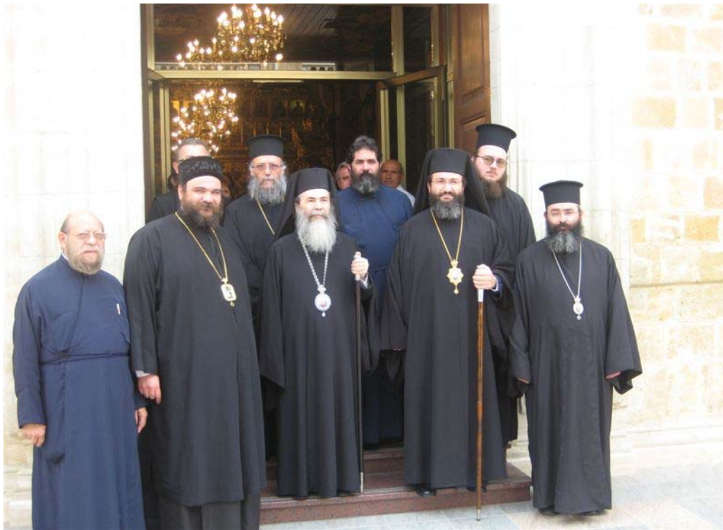
Αναμνηστική φωτογραφία από την επίσκεψη στο Μετόχιο της Ιεράς Μονής Κύκκου στη Λευκωσία.

Στη μέση διακρίνεται ο Πατριάρχης Ιεροσολύμων Θεόφιλος Γ', δεξιά οι Χωρεπίσκοποι Μεσσαορίας κ. Γρηγόριος και Αμαθούντος κ. Νικόλαος και αριστερά ο Μητροπολίτης Ταμασού κ. Ησαΐας.