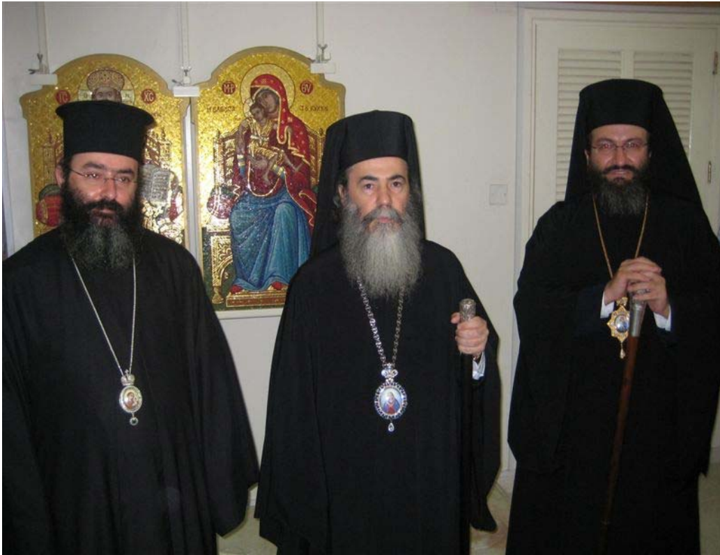
Αναμνηστική φωτογραφία με τον Πατριάρχη Ιεροσολύμων Θεόφιλο Γ', το Χωρεπίσκοπο Μεσσαορίας Γρηγόριο (δεξιά) και το Χωρεπίσκοπο Αμαθούντος Νικόλαο (αριστερά).