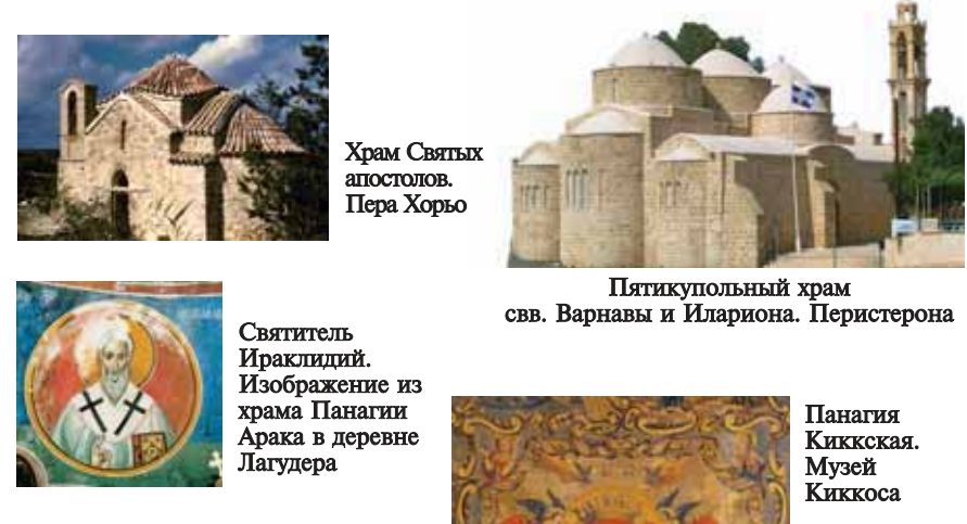
Храм Святых апостолов. Пера Хорью