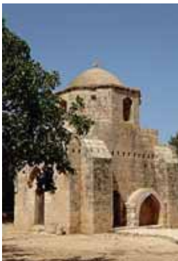
Церковь святого Маманта, Сотира