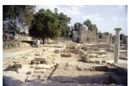
Базлика Богоматери Хрисополитиссы, Нижний Пафос. Колонна, с которую проповедовал Апостолы Павел и Варнава (45 г. н.э.)