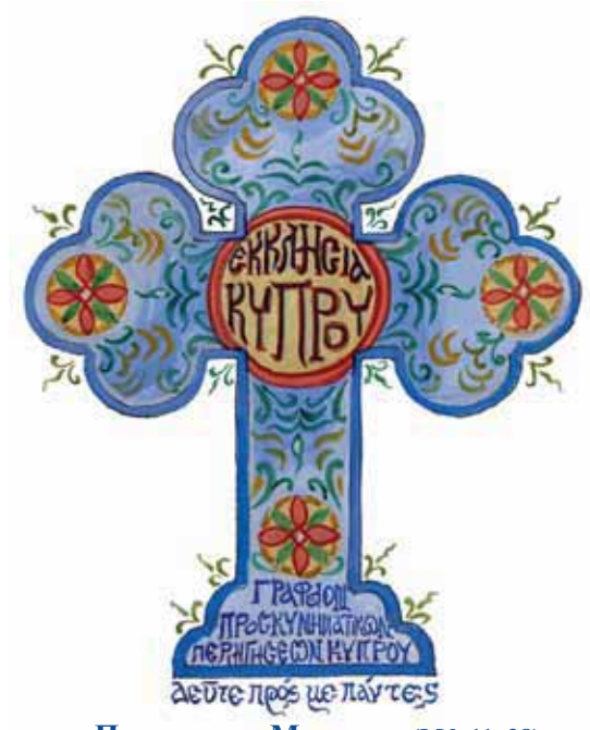
«Придите ко Мне все» (Мф.11, 28)