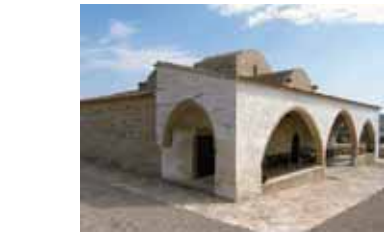
Храм св. Антония. Келли