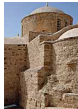
Храм Божией Матери Хриселеусы в деревне Эмпа