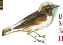
В Кикко, Кикко горах Монастырь появится. Золотая Госпожа Придет и останется.