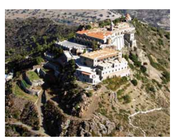
Пятикупольный храм свв. Варнавы и Илариона. Перистерона