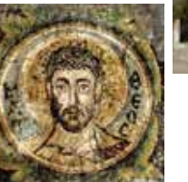
Святой Матфей. Раннехристианская мозаика (525-530). Из церкви Панагии Канакария, оккупированной Литрангом