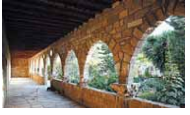
Монастырь свт. Николая тон Гатон (Кочачий), Акротири