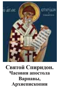
Святой Спиридон. Часовня апостола Варнавы, Архиепископия