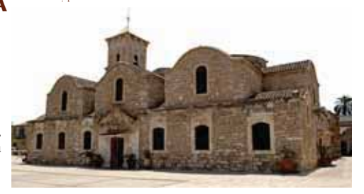
Храм св. Лазаря. Ларнака