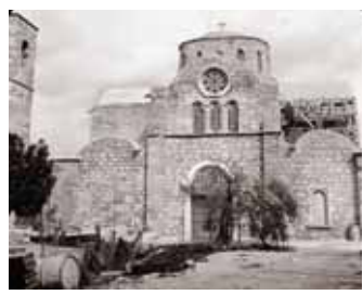
Монастырь и храм апостола Варнавы в оккупированной деревне Энгомия, Фамагуста