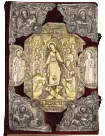
Оклад Евангелия. 1775, XIX в. 35,5x24, 3х5,5. Серебро. Монастырь св. Иоанна Лампациста, Калопапайотис.