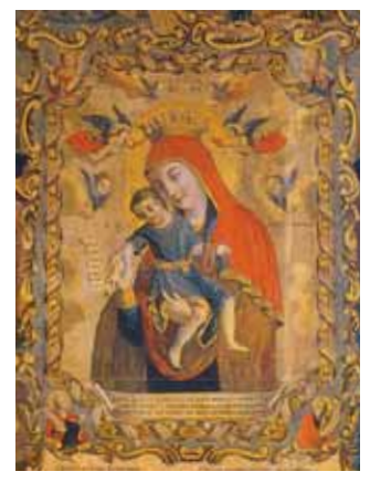
Панагия Киккская. Музей Киккоса