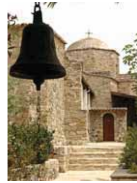
Монастырь свт. Ираклидия. Попитико