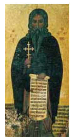
Икона св. Неофита. XVI в. 126,5 x 62,6. Музей монастыря св. Неофита-заворника