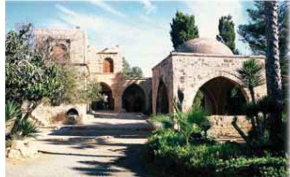
Фонтан-фиала. Монастырь Агия Напа