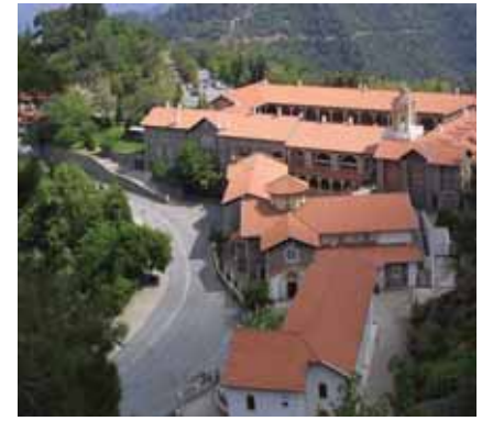
Свято-Киккская обитель. Общий вид