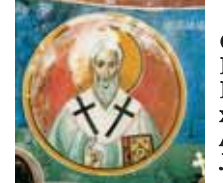
Святитель Ираклидий. Изображение из храма Панагии Арака в деревне Лагудера