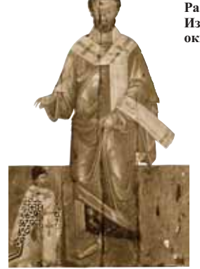
Апостол Варнава. Большой Синопольный зал Кипрской архиепископии