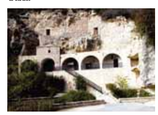
Скит св. Неофита