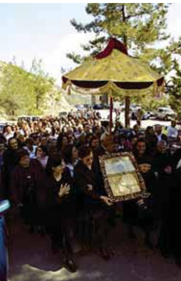
Литания с чудотворной иконой. Монастырь Панагии Махера