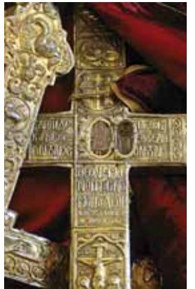
Крест с частицей Уз Христовых из храма Честного Креста в деревне Омодос