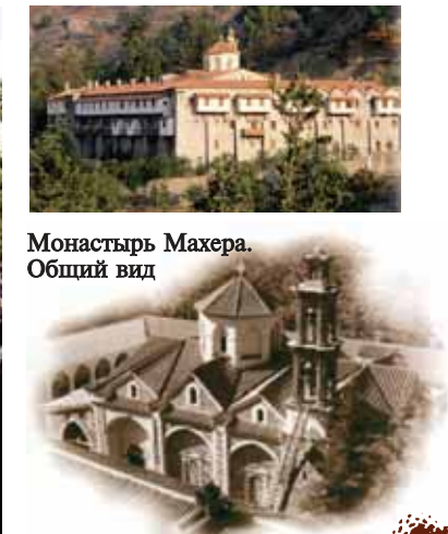
Монастырь Махера. Общий вид