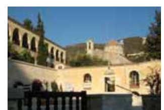
Монастырь св. Неофита. Тала