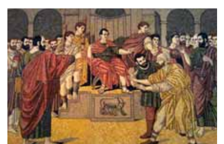
Христианизация первого римского правителя Пафоса, проконсула Сергия Павлоса, апостолом Павлом и Варнавы (45 г. н.э.)