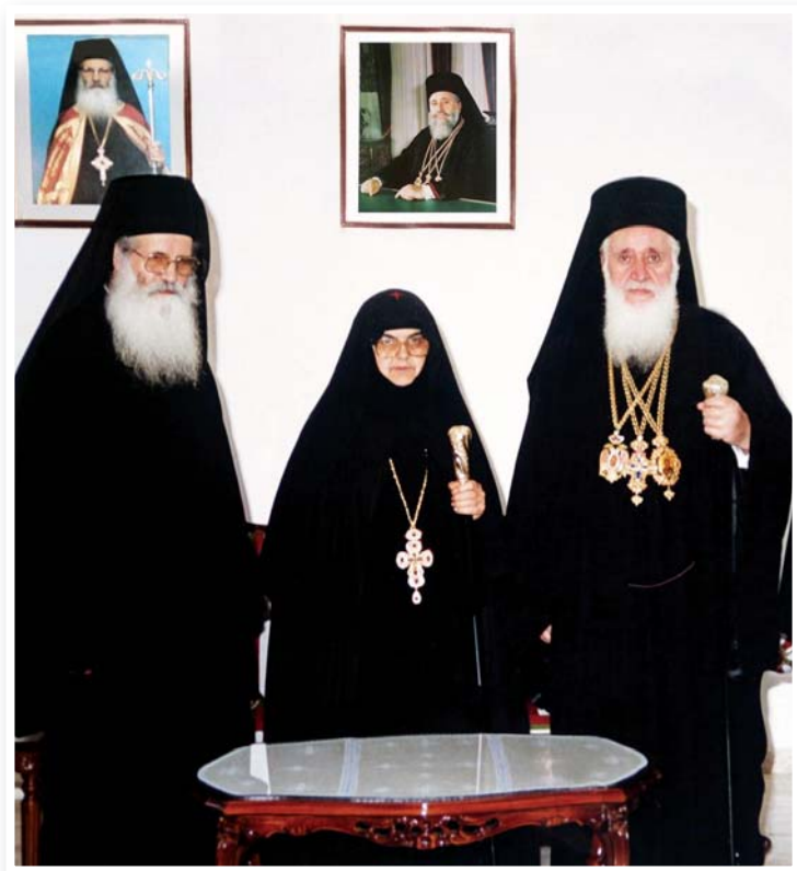
Αναμνηστική φωτογραφία από την ένθρόνιση της Ήγουμένης Εὐφημίας μέ τόν Ἀρχιεπίσκοπο Χρυσόστομο τόν Α' καί τόν Ἡγούμενο Τροοδιτίσης Ἀθανάσιο.