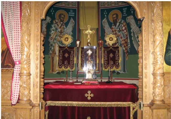
Η ώραία πύλη καί τοιχογραφίες Ίεραρχών στην άψίδα του ιεροῦ βήματος.