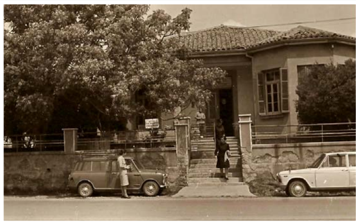
Μέλη τῆς Ἀδελφότητος «Φιλοθέη» στό σπίτι, πού ἐνοικιάστηκε γιά τήν «Πρόνοια Γήρατος».