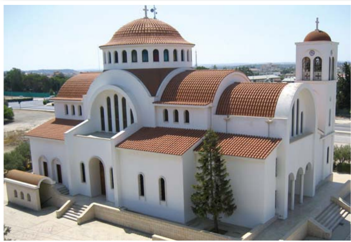
Ὁ ναός τοῦ Ἁγίου Νεκταρίου.