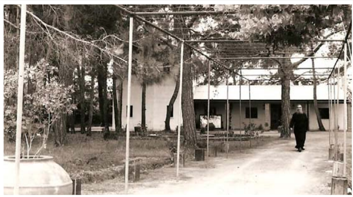
Τό πνευματικό κέντρο «Γαλήνη» στή Μύρτου.

τῶν μελῶν τους, διατηρώντας στενές σχέσεις μαζί τους, πού ἀνανεώνονταν κατά τίς συχνές ἐπισκέψεις του στό νησί. Ἀνάμεσα στά ἄλλα μερίμνησε καί γιά τήν ὀλοκλήρωση τῶν ἐργασιῶν ἀνέγερσης τοῦ διώροφου κοινοῦ οἰκήματός τους, πού εἶχαν διακοπεῖ, λόγω τῆς τουρκικῆς εἰσβολῆς. Τό ἔργο ἀποπερατώθηκε τελικά τόν Δεκέμβριο τοῦ 1975, ὅποτε δόθηκε νέα προοπτική στίς δραστηριότητες τοῦ Ἰδρύματος καί τῆς Ἀδελφότητος, ἡ ὁποία μετέφερε σέ αὐτό τήν «Πρόνοια Γήρατος».