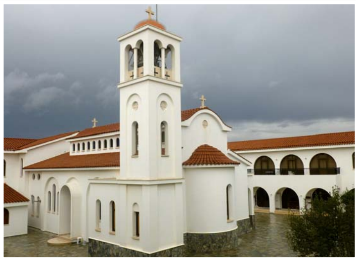
Τό καθολικό μέ τήν ἐσωτερική αὐλή καί τό μοναστηριακό οἰκοδόμημα.