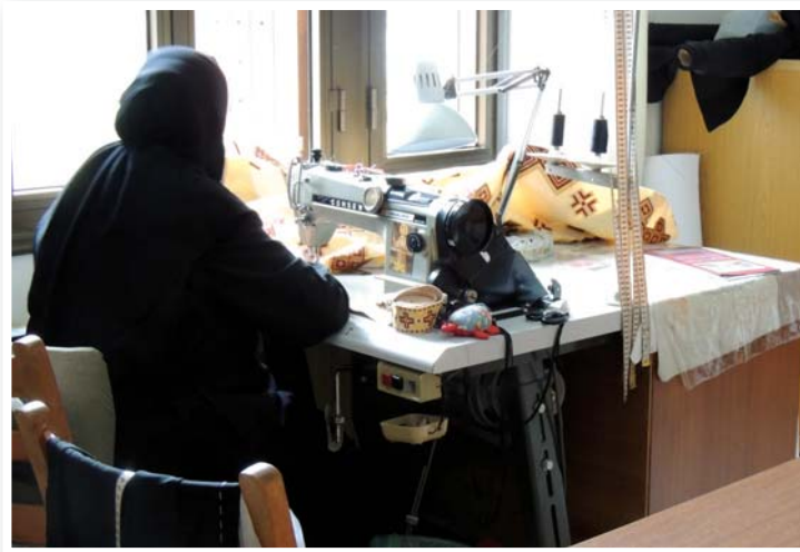
Άπό τά διακονήματα τής Άδελφότητας: στό ίεροραφεϊό.