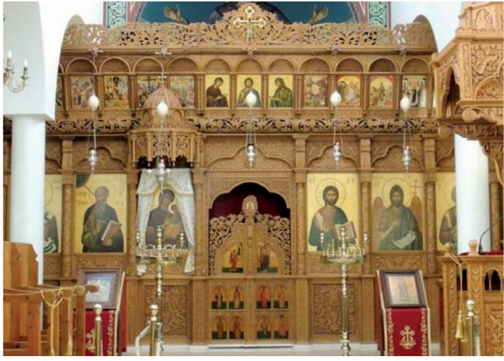
Τό έσωτερικό του ναού μέ τό ξυλόγλυπτο είκονοστάσιο.