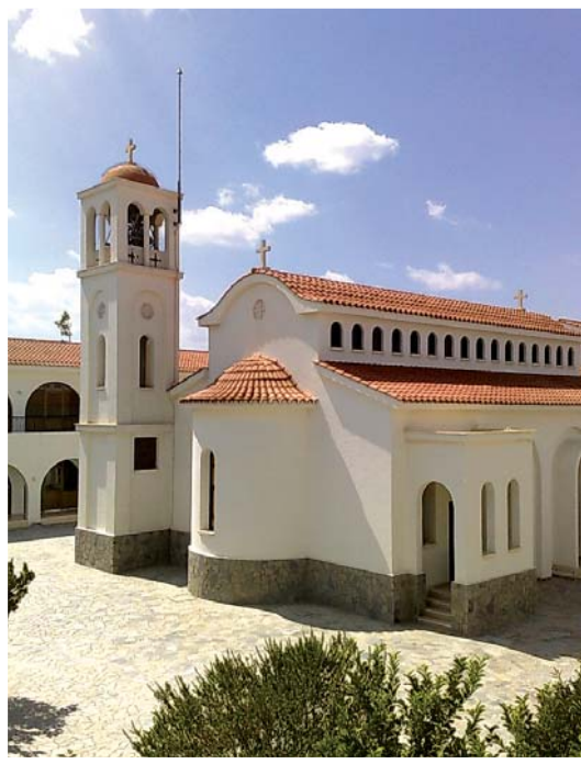
Τό καθολικό τής Μονής.

τίς υπηρεσίες του ό συνταξιούχος π. Άλέξανδρος Μιχαήλ από τό γειτονικό χωριό Καπέδες, τόν όποιο αντικατέστησαν στή συνέχεια διάφοροι ιερείς τής αρχιεπισκοπικής περιφέρειας, πού κάλυπταν τίς λειτουργικές ανάγκες τής Μονής, ενώ άργότερα όρίστηκε, ως τακτικός έφημέριος, ό π. Ήλίας Ήλιάδης από τό χωριό Γερακιές. Σήμερα υπηρετεί στή Μονή, από τό 2011, αρχικά ως διάκονος και στή συνέχεια ως πρεσβύτερος, ό π. Άνδρέας Άλεξάνδρου από τό κατεχόμενο χωριό Βασίλι τής Καρπασίας.