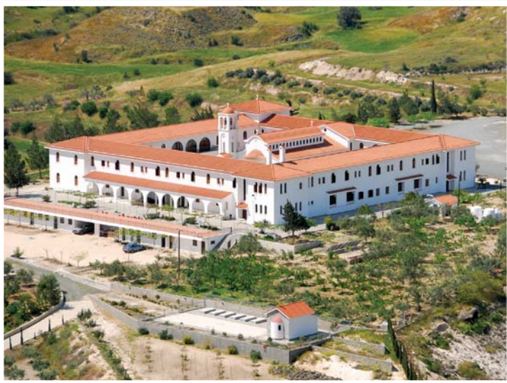
Ὅψη τῆς Μονῆς ἀπό τά βορειοανατολικά. Διακρίνεται ἐπίσης ὁ κοιμητηριακός ναός.

Κενδέα στήν Αὐγόρου, τοῦ Ἁγίου Μηναῖ στή Βάβλα, τοῦ Ἁγίου Νικολάου τῶν Γάτων στό Ἄκρωτήρι, τοῦ Ἁγίου Νικολάου στήν Ὀροῦντα, τοῦ Ἁγίου Παντελεήμονος Ἄχεραῖ στήν Ἀγροκησιά, τῶν Ἁγίων Μαρίνας καί Ραφαήλ στήν Ευλοτύμβου, τοῦ Ἀρχαγγέλου Μιχαήλ στόν Ἀναλιόντα, τῆς Ζωοδόχου Πηγῆς - Παναγίας τοῦ Γλωσσᾶ στό Κελλάκι, τῆς Θεοτόκου μεταξύ Ἀναλιόντα καί Καμπιῶν, τῆς Παναγίας τῆς Ἀμασγοῦς στό Μονάγρι, τῆς Παναγίας τῆς Ἀμιροῦς στήν Ἄψιου, τῆς Παναγίας τῆς Σαλαμιώτισσας στή Σαλαμιού, τῆς Παναγίας τῆς Σφαλαργιώτισσας στόν Ἅγιο Ἀθανάσιο, τῆς Παναγίας τῆς Τρικουκιάς στόν Πρόδρομο καί τῆς Παναγίας Χρυσοκουρδαλιώτισσας στά Κούρδαλη.