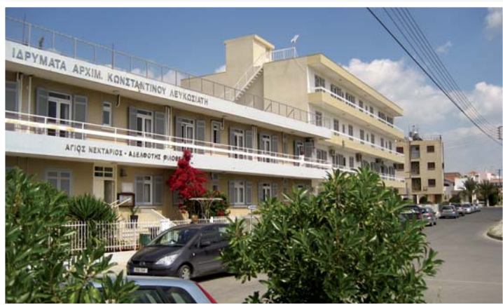
Τό οἶκημα τοῦ Ἰδρύματος «Ἅγιος Νεκτᾶριος» καί τῆς Ἀδελφότητος «Φιλοθέη».