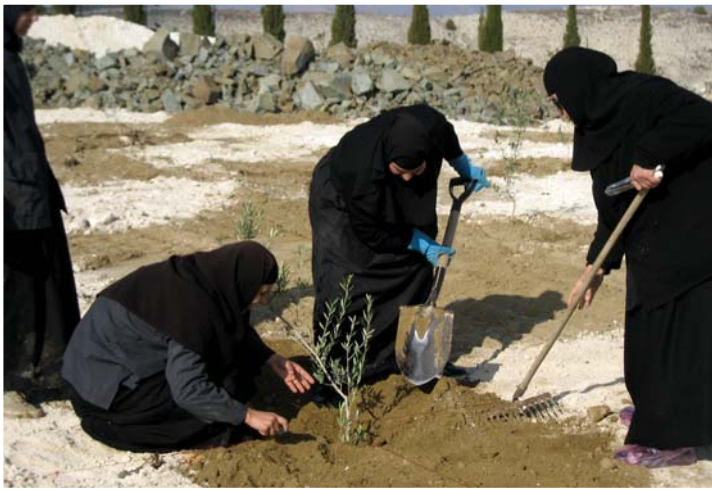
Άπό τά διακονήματα τής Άδελφότητας: φύτευση έλιās.