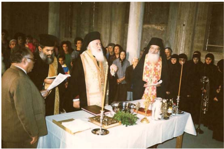
Ὁ Ἀρχιεπίσκοπος Χρυσόστομος Α' προΐσταται τῆς τελετῆς, κατὰ τὴν κατάθεση τοῦ θεμελίου λίθου.