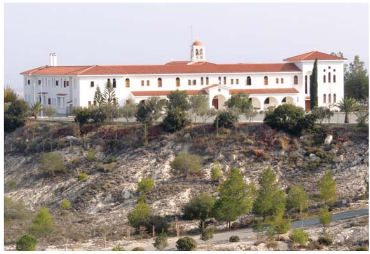
Όψη τῆς Μονῆς ἀπό τὰ βορειοδυτικά.