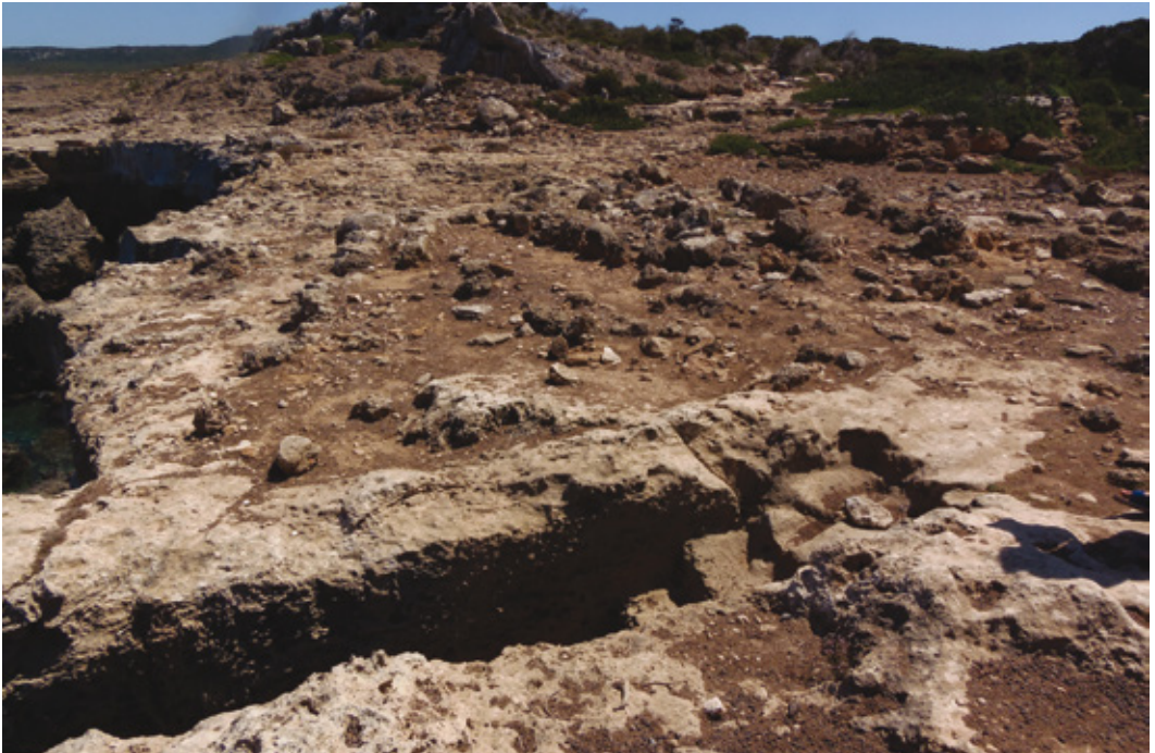
Εικ. 10. Τοποθεσία Πέντε Αγιοί. Σε πρώτο πλάνο, η λαξευτή κλίμακα που οδηγεί σε σπήλαιο αγιάσματος. Στο κέντρο διακρίνονται τα ερείπια βυζαντινού ναού.