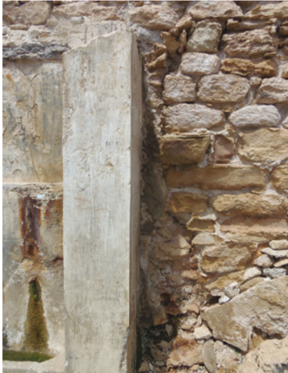
Εικ. 5. Λίθινος πρόβολος, βορείως του αγιάσματος.

“[...] Latin Roman Catholic monks built a chapel there on the site of an older one in a cave from which bubbled up a spring ”. 14