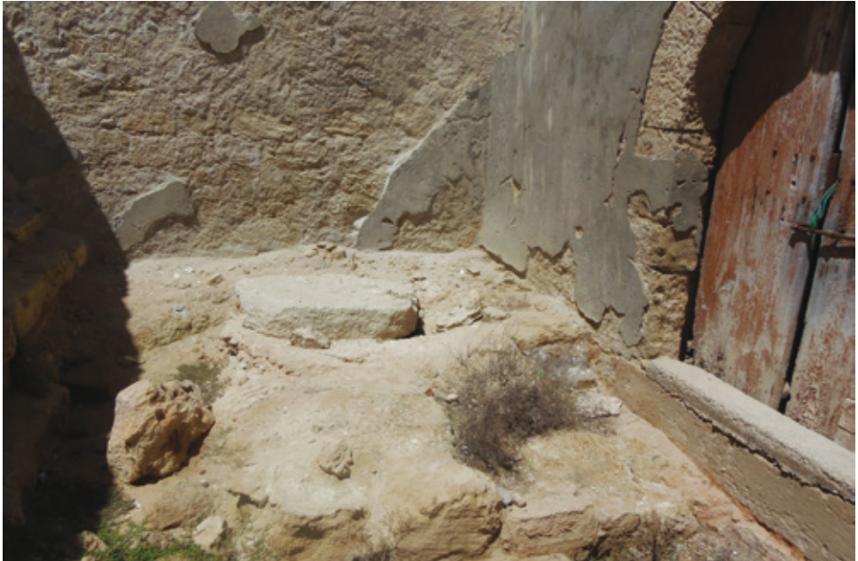
Εικ. 6. Στόμιο πηγαδιού σφραγισμένο με λίθινη πλάκα, στη νοτιοδυτική εξωτερική πλευρά του παρεκκλησίου (Α. Φούλιας, 2019).