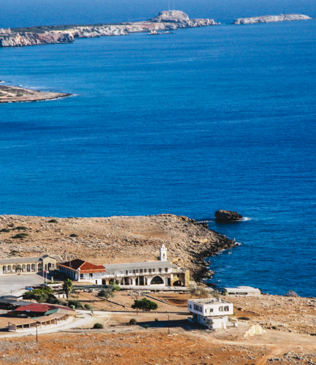
Εικ. 2. Πανοραμική άποψη με τη Μονή του Αποστόλου Ανδρέα και την αρχαιολογική θέση Κάστρος, στο βάθος.