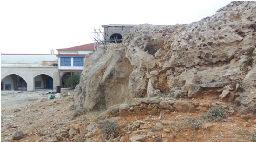
Εικ. 11. Ερείπια κτηρίου άγνωστης χρήσης, βορείως της μονής (Α. Φούλιας, 2019).