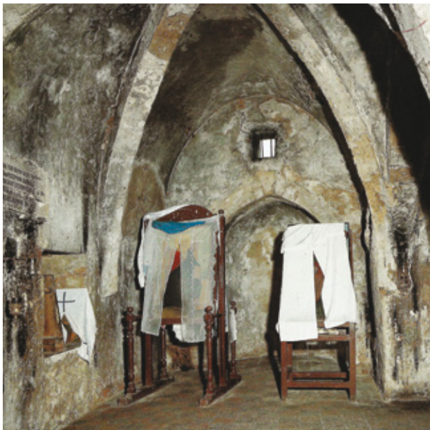
Εικ. 7. Το εσωτερικό του παρεκκλησίου προς ανατολάς, προ του 1974 (R. Wideson, Cyprus, Images of a Lifetime , Λεμεσός 1992).