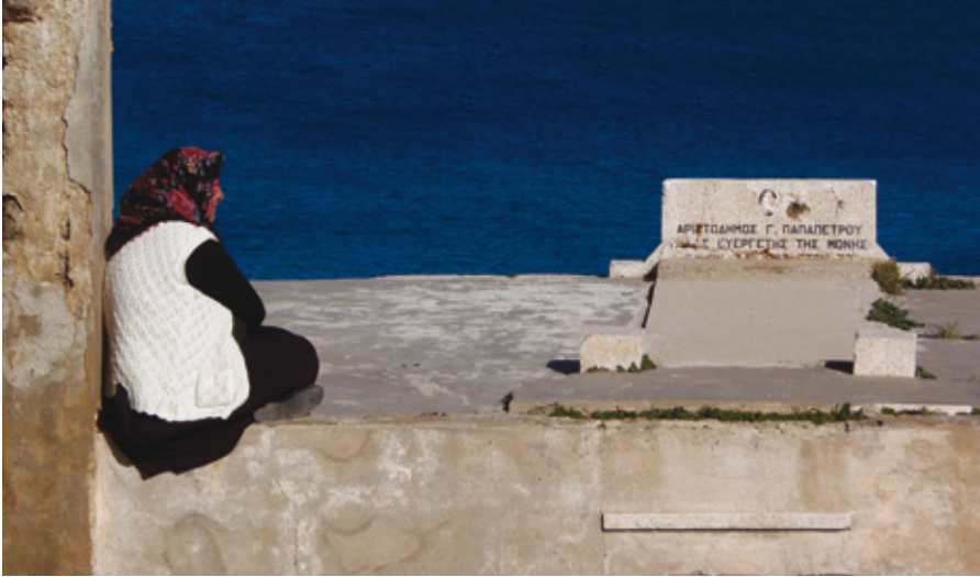
Εικ. 9. Ο τάφος του ευεργέτη Αριστόδημου Γ. Παπαπέτρου (Α. Φούλιας, 2012).

ότι το τετράγωνο παράθυρο, που βρίσκεται στον βόρειο τοίχο, ίσως είναι παλαιότερο του μεσαιωνικού παρεκκλησίου. Σε φωτογραφία του τέλους του 19ου αιώνα φαίνεται λίθινο τέμπλο, το οποίο στη συνέχεια χάθηκε. Ίχνη του τέμπλου αυτού εντοπίστηκαν στις τελευταίες ανασκαφές (2018). 31