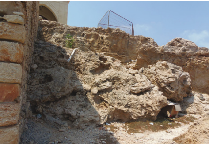
Εικ. 4. Διαβρωμένοι βράχοι από πεσμένο σπήλαιο, βορείως του μεσαιωνικού παρεκκλησίου (Α. Φούλιας, 2019).

Από την αναφορά αυτή συνάγεται ότι η μονή, λίγα χρόνια προτού την επισκεφθεί ο Roscoe, βρισκόταν σε λειτουργία, ενώ ασαφής παραμένει η αναφορά για τον τρόπο με τον οποίο αυτή ήταν κτισμένη· προφανώς, δεν έχει σωθεί τίποτε από το κτήριο αυτό.