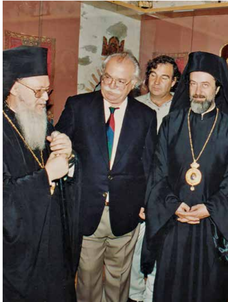
Ξενάγηση τοῦ Οἰκουμενικοῦ Πατριάρχου Κωνσταντινουπόλεως κ.κ. Βαρθολομαίου στήν Ἐκθεση εἰκόνων καί κειμηλίων τῆς μονῆς Κουτλουμουσίου, στόν Πύργο τῆς μονῆς (1994).

στόν παλαιοχριστιανικό ναό τοῦ Ὁσίου Δαβίδ, καθολικοῦ τῆς μονῆς Λατόμου, ἐργασίες πού στάθηκαν σωτήριες γιά τό μνημεῖο στόν καταστροφικό σεισμό, πού ἐπληξε τήν πόλη τό 1978. Τότε ἀποκαλύφθηκαν στόν ναό ἐξαιρετικῆς ποιότητος βυζαντινές τοιχογραφίες, οἱ ὁποῖες ἀπέτελεσαν τό θέμα τῆς διδακτορικῆς του διατριβῆς, Οἱ τοιχογραφίες τῆς μονῆς Λατόμου Θεσσαλονίκης καί ἡ βυζαντινὴ ζωγραφικὴ τοῦ 12ου αἰώνα (μονογραφία ἀριθ. 1. 2). Τό βιβλίο, μετὰ ἀπό πρόταση τοῦ ἀκαδημαϊκοῦ Μανόλη Χατζηδάκη, τιμήθηκε τό 1987 μέ βραβεῖο τῆς Ἀκαδημίας Ἀθηνῶν.