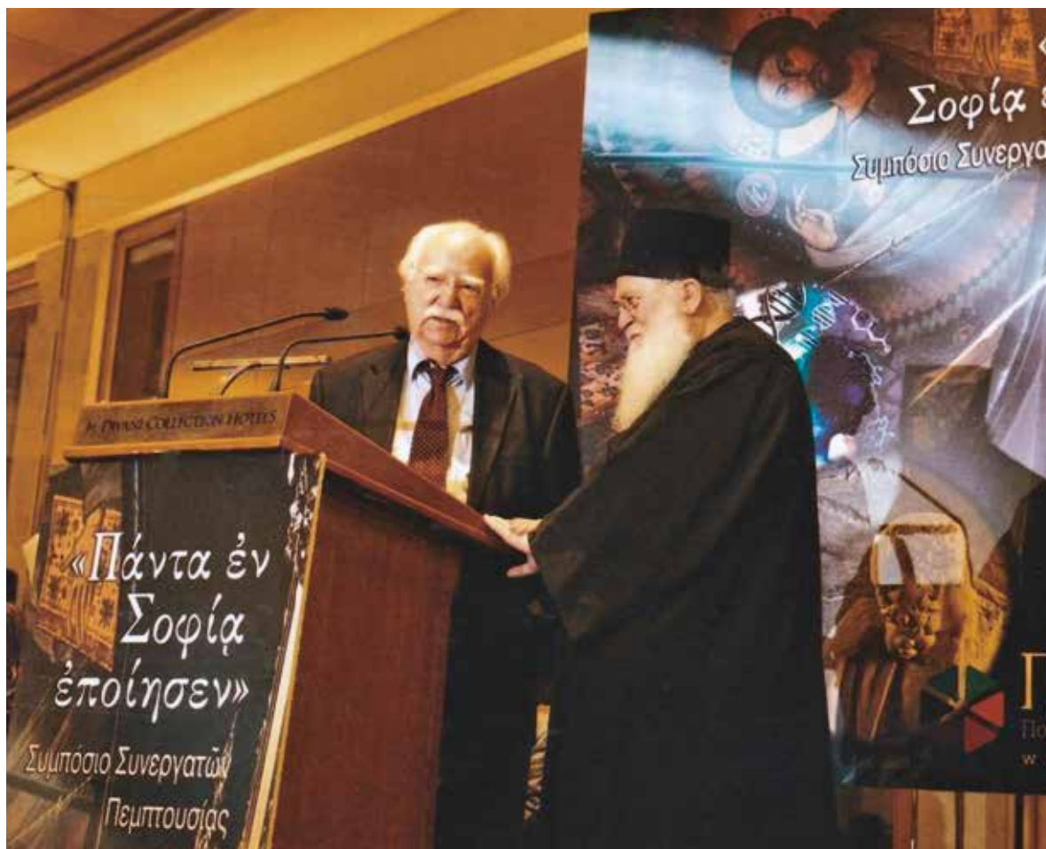
Βράβευση τοῦ τιμωμένου ἀπὸ τὸν ἡγούμενο τῆς μονῆς Βατοπαιδίου γιὰ τὸ πολὺπλευρο ὑπηρεσιακὸ καὶ ἐπιστημονικὸ του ἔργο πρὸς τὴ μονή (2017).

τοῦ Θεοφάνη τοῦ Κρητός. Ἡ μακρὰ αὐτή, συστηματικὴ συντήρηση τοιχογραφιῶν σὲ σημαίνοντα καθολικὰ καὶ Τράπεζες ἀνοίγει νέους δρόμους στὴν ἔρευνα τῆς ἀγιορείτικης παράδοσης στὴ μνημειακὴ ζωγραφικὴ καὶ στὰ εἰκονογραφικὰ προγράμματα.