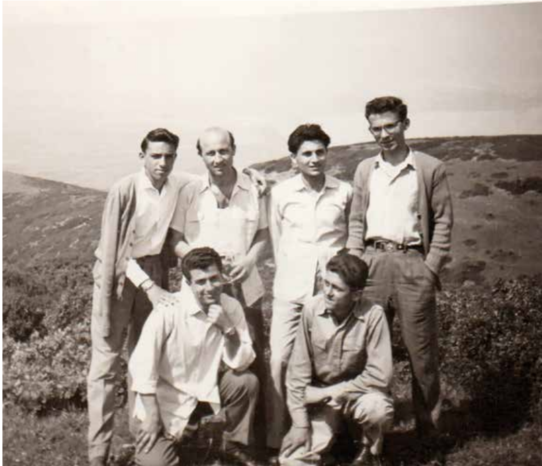
Τελειόφοιτος Γυμνασίου μέ συμμαθητές καί φίλους (1955).

άπό τριακονταετή, πολλαπλά γόνιμη θητεία, προκειμένου νά έπιδοθεϊ άποκλειστικά στό καθήκοντα τοῦ καθηγητῆ τῆς Θεολογικῆς Σχολῆς τοῦ ΑΠΘ, ὅπου τό 1989 εἶχε έκλεγεί παμψηφεί ὡς Έπίκουρος Καθηγητής καί έν συνεχείᾳ Άναπληρωτής καί Τακτικός τό 1996. Ὡς καθηγητής προσφέρει τήν ὑπηρεσιακή καί έπιστημονική διακονία του στό Πανεπιστήμιο, ὅπου ὑπηρέτησε επί δεκαπενταετία καί άπ' ὅπου συνταξιοδοτήθηκε τό 2004 καί έλαβε τόν τίτλο τοῦ ὁμοτίμου.