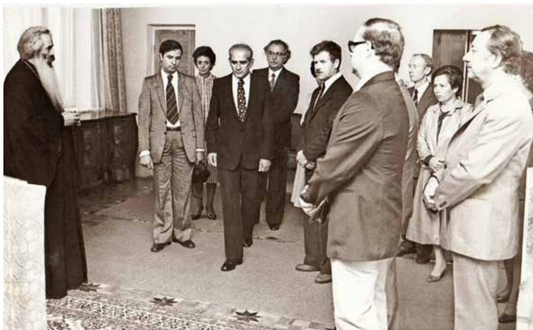
Στό Κίεβο μέ τόν μητροπολίτη Κίεβου καί καθηγητές τῆς Θεολογικῆς Σχολῆς τοῦ ΑΠΘ, στά πλαίσια περιοδείας στήν τότε Σοβιετική Ένωση, ὕστερα ἀπό πρόσκληση τοῦ Πατριαρχείου τῆς Μόσχας (1982).

κανίδη τοιχογραφίες σέ ἄλλους τρεῖς ναούς τῆς πόλης (Ταξιάρχη τῆς Μητροπόλεως, 1359-1360· Ἅγιο Ἀθανάσιο τοῦ Μουζάκη, 1383-1384· Ἅγιο Ἀνδρέα τοῦ Ρουσούλη, 1441/2), μαζί μέ τοιχογραφίες ἐργαστηρίων τῆς Καστοριᾶς σέ τέσσερις ναούς τῆς σημερινῆς Ἀλβανίας στήν περιοχή τῆς Κορυτσᾶς (Borje, Bobostica) καί στό ἄλβανικό τμήμα τῆς Μεγάλης Πρέσπας