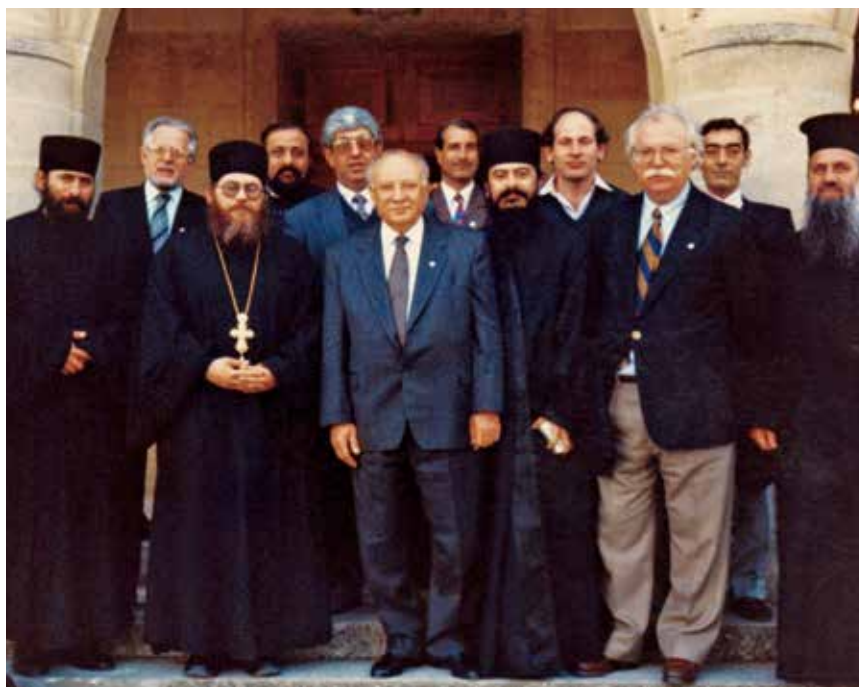
Λευκωσία, στήν εἴσοδο τοῦ προεδρικοῦ μεγάρου, μέ τόν πρόεδρο τῆς Κυπριακῆς Δημοκρατίας Γλαῦκο Κληρίδη καί τόν καθηγούμενο τῆς μονῆς Βατοπαιδίου πανοσιολογιώτατο ἀρχιμανδρίτη Ἐφραίμ (1993).

Ὁ αἰμίμηστος ἀκαδημαϊκός Μανόλης Χατζηδάκης, ἔχοντας ὑπόψιν τό σημαντικό ἐρευνητικό καί ἐπιστημονικό ἔργο πού ἐπέτελεσε ὁ τιμώμενος στή Βέροια, τοῦ ἀνέθεσε, στό πλαίσιο τοῦ προγράμματος γιά τό «Σύνταγμα τῶν βυζαντινῶν τοιχογραφιῶν τῆς Ἑλλάδος» τῆς Ἀκαδημίας Ἀθηνῶν, τό