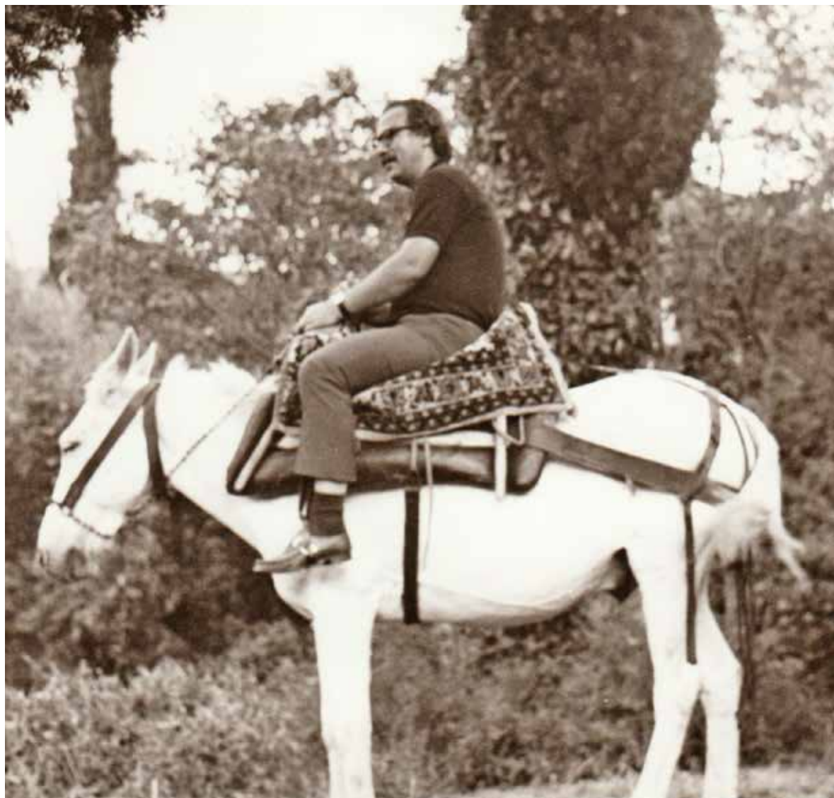
Περιοδεύοντας στο Άγιον Όρος με «αυτόκίνητο ενός ίππου» (1972).

κτώ χρόνια, συντάσσοντας και έναν σύντομο αρχαιολογικό οδηγό (ἀριθ. IV. 3).