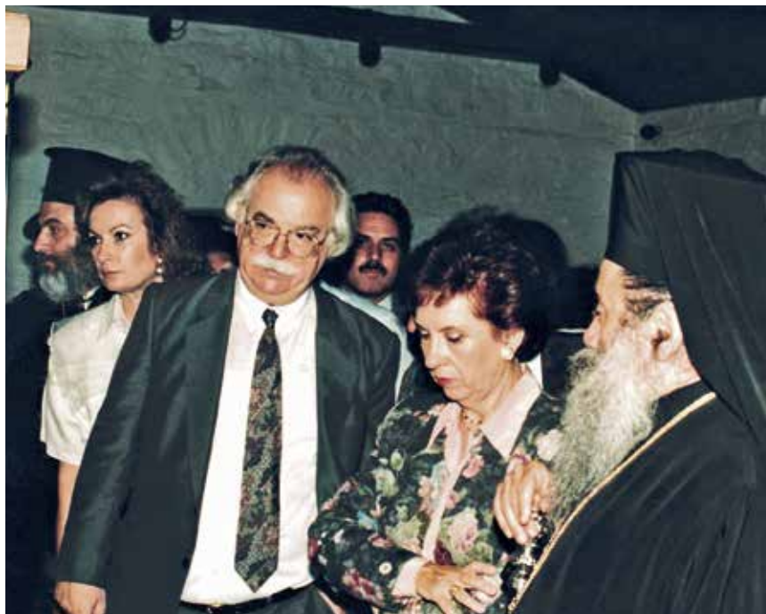
Ξενάγηση τῆς Ὑπουργοῦ Πολιτισμοῦ Α. Ψαρούδα-Μπενάκη στήν Ἐκθεση «Χριστιανική Χαλκιδική» στόν πύργο τῆς Οὐρανούπολης (1992).