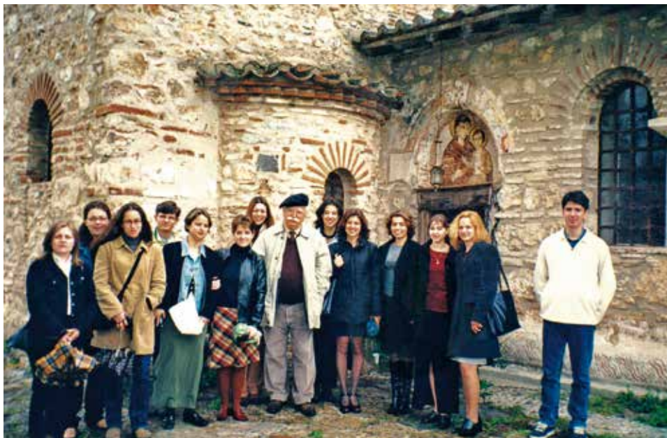
Μέ φοιτητές τῆς Θεολογικῆς Σχολῆς τοῦ ΑΠΘ σέ ἐκπαιδευτική ἐκδρομὴ (1998).