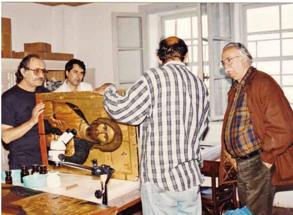
Στή μονή Βατοπαιδίου παρέχοντας οδηγίες για τή συντήρηση τῶν φορητῶν εἰκόνων (1993).

Τό συνολικό ἐπιστημονικό ἔργο γιά τή Βέροια τοῦ Τσιγαρίδα ἀνέρχεται σέ μία μονογραφία (ἀριθ. I. 3) καί σέ δεκαέξι ἄρθρα. Ὅπως στήν Καστοριά, ἔτσι καί ἐδῶ διευρύνθηκε, μέ τό πλῆθος τῶν ἐργασιῶν, ἡ εἰκόνα γιά τήν καλλιτεχνική φυσιογνωμία αὐτῆς τῆς σημαντικῆς βυζαντινῆς καί μεταβυζαντινῆς πόλης, ὥστε νά ἀντιλαμβανόμεθα καλύτερα τό περιβάλλον, ὅπου ἔδρασε ἐδῶ τόν 14ο αἰ. ὁ Θεσσαλονικέας ζωγράφος Γεώργιος Καλλιέργης (ναός Χριστοῦ, 1315), «Θεσσαλίας ὄλης ἄριστος ζωγράφος», ὅπως αὐτοσυστήνεται.