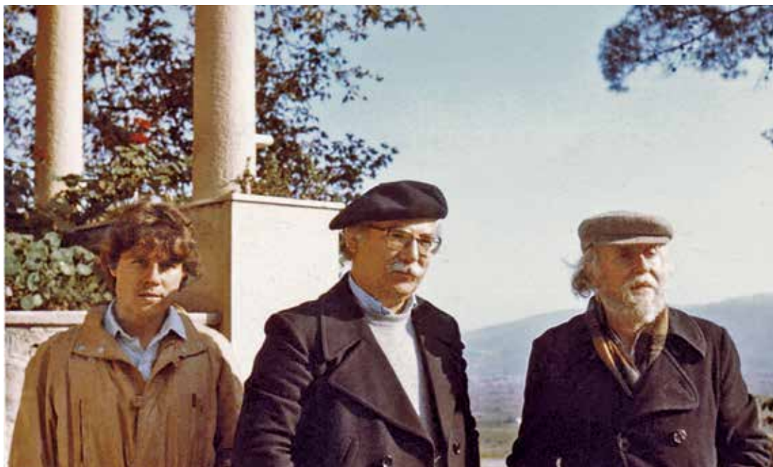
Με τόν Γιάννη Τσαρούχη στή Βέροια (1981), αναζητώντας, κατ' έπιθυμία του, μιá φορητή εικόνα μέ «ύπέροχο πράσινο βάθος».