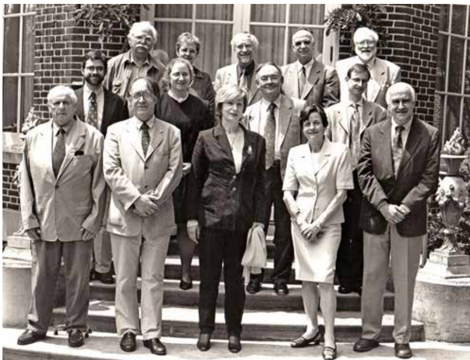
Στό Dumbarton Oaks τῶν ΗΠΑ μέ συνέδρους τοῦ Συμποσίου γιά τή βυζαντινὴ Θεσσαλονίκη (2001).

Monumental Painting in Thessaloniki in the Middle and Late Byzantine Period. Ἐδῶ συνοψίζεται ὁλόκληρη ἡ σύγχρονη προβληματική γιά σωρεία σοβαρῶν θεμάτων, ὅπως: χρονολόγηση ἢ/καί ἀναχρονολόγηση μνημείων-κλειδιῶν, δράση ἐπωνύμων καί ἀνωτύμων ζωγράφων, ἀνάδειξη τοῦ κυρίαρχου ρόλου τῆς Κωνσταντινούπολης ὡς κέντρου