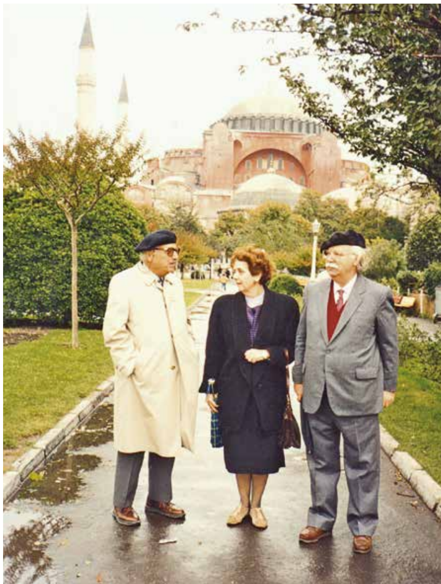
Στήν Κωνσταντινούπολη με τόν άκαδημαϊκό Π. Βοκοτόπουλο με άφορμή τήν ένθρόνιση τοϋ Οίκουμενικοϋ Πατριάρχη κ.κ. Βαρθολομαίου (1991).

έπίσης τίς άποτοιχισμένες τοιχογραφίες (τέλους 14ου-15ου αί.) τοϋ μή σωζόμενου σήμερα ναοϋ τής Παναγίας Φωτίδας (μονογραφία άριθ. Ι. 3).