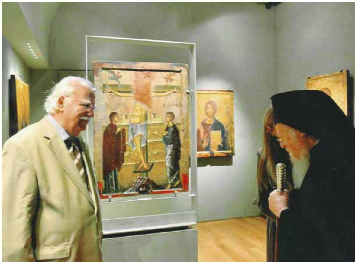
Συνομιλώντας με τόν οίкуμηνικό πατριάρχη Κωνσταντινουπόλεως κ.κ. Βαρθολομαίο στήν Έκθεση εικότων του Πατριαρχικού Ίδρύματος Μελετών στή μονή Βλατάδων τής Θεσσαλονίκης (2018).

στήν Ελλάδα καί τό έξωτερικό, πού άφοροῦν τοιογογραφίες καί κατεξοχήν φορητές εικόνες.