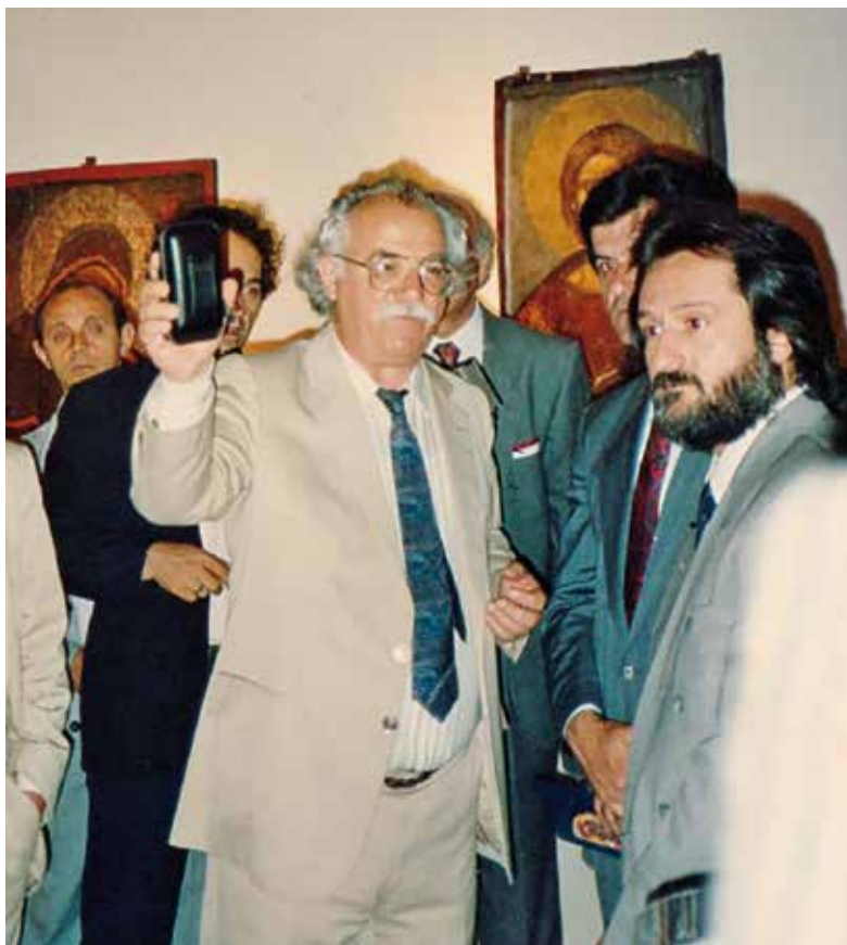
Ξενάγηση τῶν ἐπισήμων στά ἐγκαίνια τοῦ Βυζαντινοῦ Μουσείου Καστοριάς (1989).

V. 1-4, 6-11, 13-14), ὡς καί ἕναν ἀρχαιολογικό ὁδηγό (ἀριθ. IV. 3).