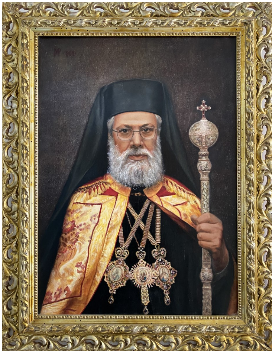
Μνημόσυνο στον μακαριστό Αρχιεπίσκοπο Κύπρου κυρό Χρυσόστομο Β΄ 5 Νοεμβρίου 2006 - 7 Νοεμβρίου 2022