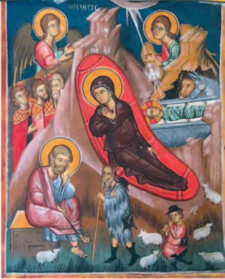
Τοιχογραφία Γέννησης Χριστοῦ, Μονή Λαμπαδιστή

Δρός Χριστόδουλου Χατζήχριστοδούλου Βυζαντινολόγου