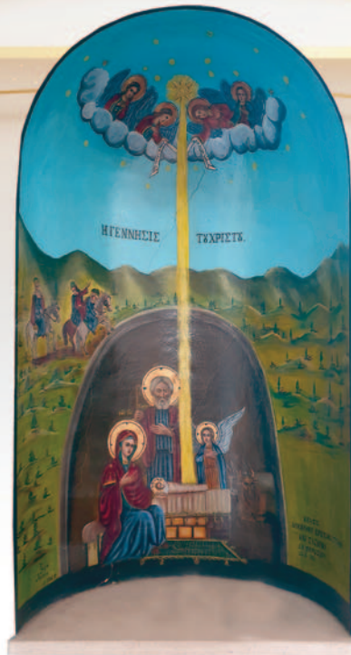
Γέννηση Χριστού, Άγιος Ίωάννης Βαρωσίων

πτύσσεται ή Κυπριακή Σχολή ζωγραφικής, ή όποία διατηρεί άφενός τή μακροχρόνια παράδοση της βυζαντινής ζωγραφικής και άφετέρου άφομοιώνει τίς επιδράσεις της ίταλικής τέχνης. Η τέχνη αυτή έδωσε μεγάλο αριθμό τοιχογραφιών και φορητών εικόνων σ' όλόκληρη την Κύπρο. Μεταξύ αυτών οι τοιχογραφίες του καθολικού