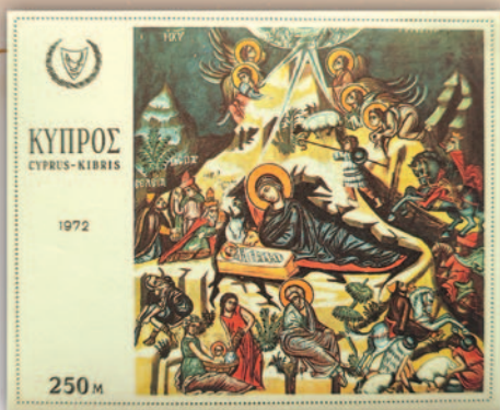
Χριστουγεννιάτικο φεγιέ Κυπριακής Δημοκρατίας 1971

τόν ναό τοῦ Τιμίου Σταυροῦ τοῦ Ἁγιοσμάτι στήν Πλατανιστάσα, καθώς καί τρία γραμματόσημα μέ λεπτομέρειες τῆς προαναφερθείσας παράστασης.