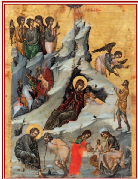
Ἡ Γέννηση τοῦ Χριστοῦ, 16ος αἰώνας, ἀπὸ τὸν ναὸ Ἁγίου Νικολάου, Ἅγιος Νικόλαος Λευκονοίκου, Βυζαντινὸ Μουσεῖο Ἰδρύματος Ἀρχιεπισκόπου Μακαρίου Γ΄.

Πρὶν ἀπὸ τὴν ἐνανθρώπηση τοῦ Θεοῦ ἡ ὕλη καὶ ὅλα τὰ φαινόμενα θεωροῦνταν ὅτι ἦσαν θεοποιημένα ἢ δαιμονοποιημένα. Οἱ ἄνεμοι ἀποδίδονταν στὸν Αἴολο, οἱ τρικυμίες στὸν Ποσειδώνα. Οἱ κεραυνοὶ κατασκευάζονταν, τάχα, ἀπὸ τὸν Ἥφαιστο κι ἐκτοξεύονταν ἀπὸ τὸν Δία. Αὐτὲς οἱ ἀντιλήψεις ἦσαν τροχοπέδη καὶ στὴν ἀνάπτυξη τῶν ἐπιστημῶν. Πῶς θὰ ἀσχολοῦνταν, π.χ., οἱ ἄνθρωποι μὲ τὴν ἔρευνα γιὰ τὴν ἐφεύρεση ἐνὸς μέσου γιὰ τὴν ἐξουδετέρωση τῶν κεραυνῶν, ὅταν ἔτσι θὰ ἔρχονταν σὲ ἀντιπαράθεση μὲ τὸν Δία; Πῶς θὰ ἐγχείριζαν ἕναν ἀσθενή, ἢ πῶς θὰ ἀνέλυαν τὴν ὕλη σὲ χημικὸ ἐργαστήριο, ὅταν φοβόντουσαν ὅτι θὰ προκληθεῖ ἡ μῆνις τῶν δαιμονικῶν δυνάμεων; Μὲ τὴν ἐνανθρώπηση τοῦ Θεοῦ δόθηκε τὸ μήνυμα πῶς ἡ ὕλη δὲν εἶναι σατανική, οὔτε μυστηριώδης. Ὁ ἴδιος ὁ Θεὸς τὴν προσλαμβάνει καὶ τὴν ἀγιάζει.