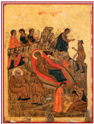
Ἡ Γέννηση τοῦ Χριστοῦ, 17ος αἰώνας, εἰκόνα ἀπό ἄγνωστο ναό. Ἐπαναπατρίσθηκε ἀπό τό Μόνα- χο μετά ἀπό δικαστικούς ἀγῶνες τόν Νοέμβριο 2013, Βυζαντινῶ Μουσεῖο Ἰδρύματος Ἀρχιεπισκόπου Μακαρίου Γ΄

Ὁ ἀπόστολος Παῦλος ἦρθε στόν Ἄρειο Πάγο, στήν Ἀθήνα, ὅπου ἐλαμπαν ὅλα τά λαμπρά φῶτα τῆς ἐπιστήμης καί τῆς φιλοσοφίας, καί ἐκεῖ, στήν καρδιά τοῦ ἀρχαίου κό- σμου, ἐκήρυξε τόν σταυρωμένο καί