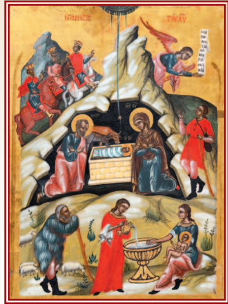
Ἡ Γέννηση τοῦ Χριστοῦ, περί τό 1627, ἔργο Παύλου Ἱερογράφου, ἀπό τόν ναό Ἁγίου Νικολάου τῆς Στέγης, Κακοπετριά, Βυζαντινό Μουσείο Ἰδρύματος Ἀρχιεπισκόπου Μακαρίου Γ΄

ε) Τέλος, τό μεγάλο μήνυμα τῶν Χριστουγέννων εἶναι τό μήνυμα τῆς θέωσης τοῦ ἀνθρώπου. Ὁ Χριστός ἦρθε στόν κόσμο γιά νά μᾶς δώσει τή δυνατότητα, νά μᾶς ἐφοδιάσει μέ τά μέσα, ὥστε νά μπορέσουμε νά τελειοποιηθοῦμε, νά ὁμοιωθοῦμε μέ τόν Θεό. Πολλοί νομίζουν πώς ὁ σκοπός τῆς γέννησης τοῦ Χριστοῦ ἐξαντλεῖται στή λύτρωση τοῦ ἀνθρώπου ἀπό τήν ἁμαρτία καί τόν διάβολο. Θέτουν τό γεγονός τῆς ἐνανθρώπησης τοῦ Θεοῦ ὡς ἀντίβαρο στήν πτώση τῶν πρω-