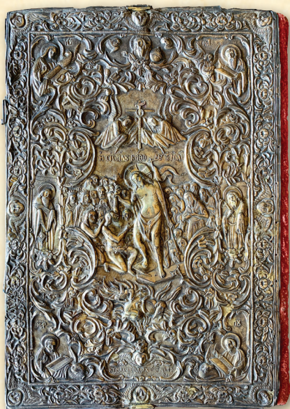
Ἰερὸ Εὐαγγέλιο Κοντέας («Ἐνετίησιν. 1799»,)