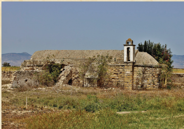
Ναός Παναγίας Εὐαγγελιστρίας, Ἰσσία (πρὶν καὶ μετὰ τὴ συντήρησή του)