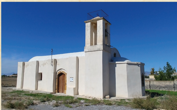
Ναὸς Ἁγίας Παρασκευῆς, Στρογγυλός