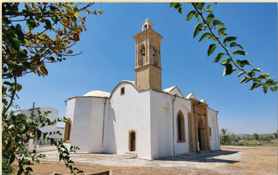
Ναὸς Ἁγίου Ἀνδρονίου, Κυθρέα

Ἐρὰ Ἀρχιεπισκοπῆ Κύπρου, 10 Ἰουλίου 2023.