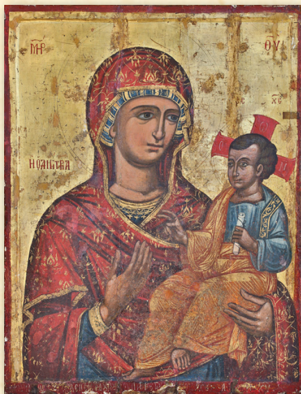
Εἰκόνα Παναγίας Χαρδακιωτίσσης (16ος αἰώνας), Ναὸς Παναγίας Χαρδακιωτίσσης, Κυθρέα