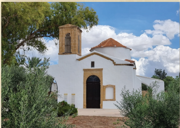
Ναὸς Παναγίας Θεοτόκου, Τραχώνι Κυθρέας (πρὶν καὶ μετὰ τὴ συντήρησή του)