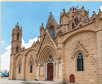
Ναὸς Παναγίας τῆς Λύσης