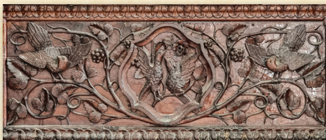
Λεπτομέρεια τέμπλου Ναοῦ Ἁγίας Παρασκευῆς, Ἄγκαστινα