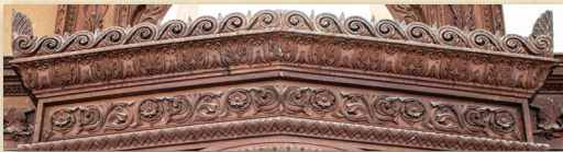
Λεπτομέρεια τέμπλου Ναοῦ Ἅγίου Γεωργίου, Ἔξω Μετόχι