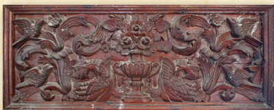
Λεπτομέρεια τέμπλου Ναοῦ Παναγίας, Λύση