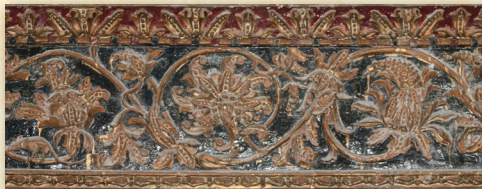
Λεπτομέρεια τέμπλου Ναοῦ Ἁγίας Μαρίας, Κυθρέα