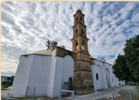
Ναὸς Ἁγίου Χαραλάμπους, Νέο Χωριό Κυθρέας