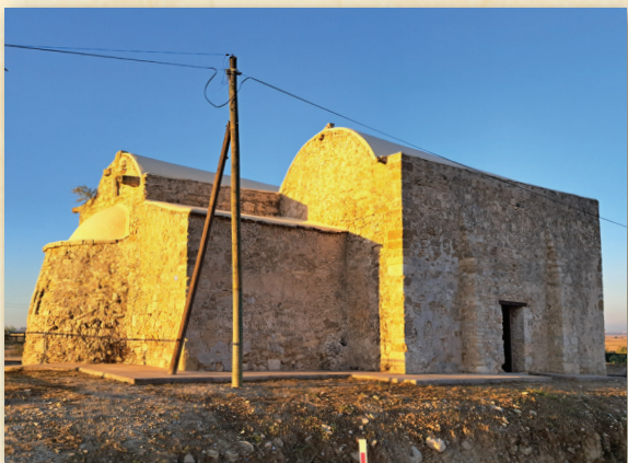
Ναός Αγίου Ἀρτέμονος, Ὀρνίθι (πρὶν καὶ μετὰ τὴ συντήρησή του)