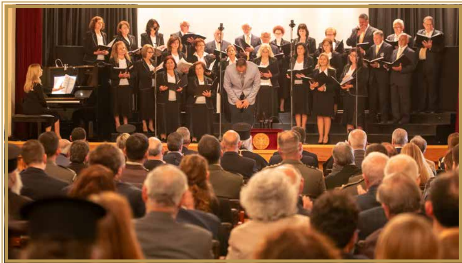
Η Χορωδία του Δήμου Λακατάμειας επί σκηνής.