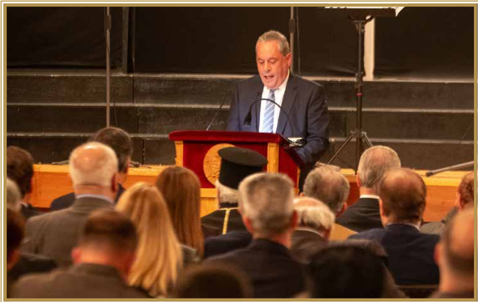
Ο Υπουργός Άμυνας κ. Βασίλης Πάλλμας απευθύνει χαιρετισμό εκ μέρους του Προέδρου της Δημοκρατίας κ. Νίκου Χριστοδουλίδη.