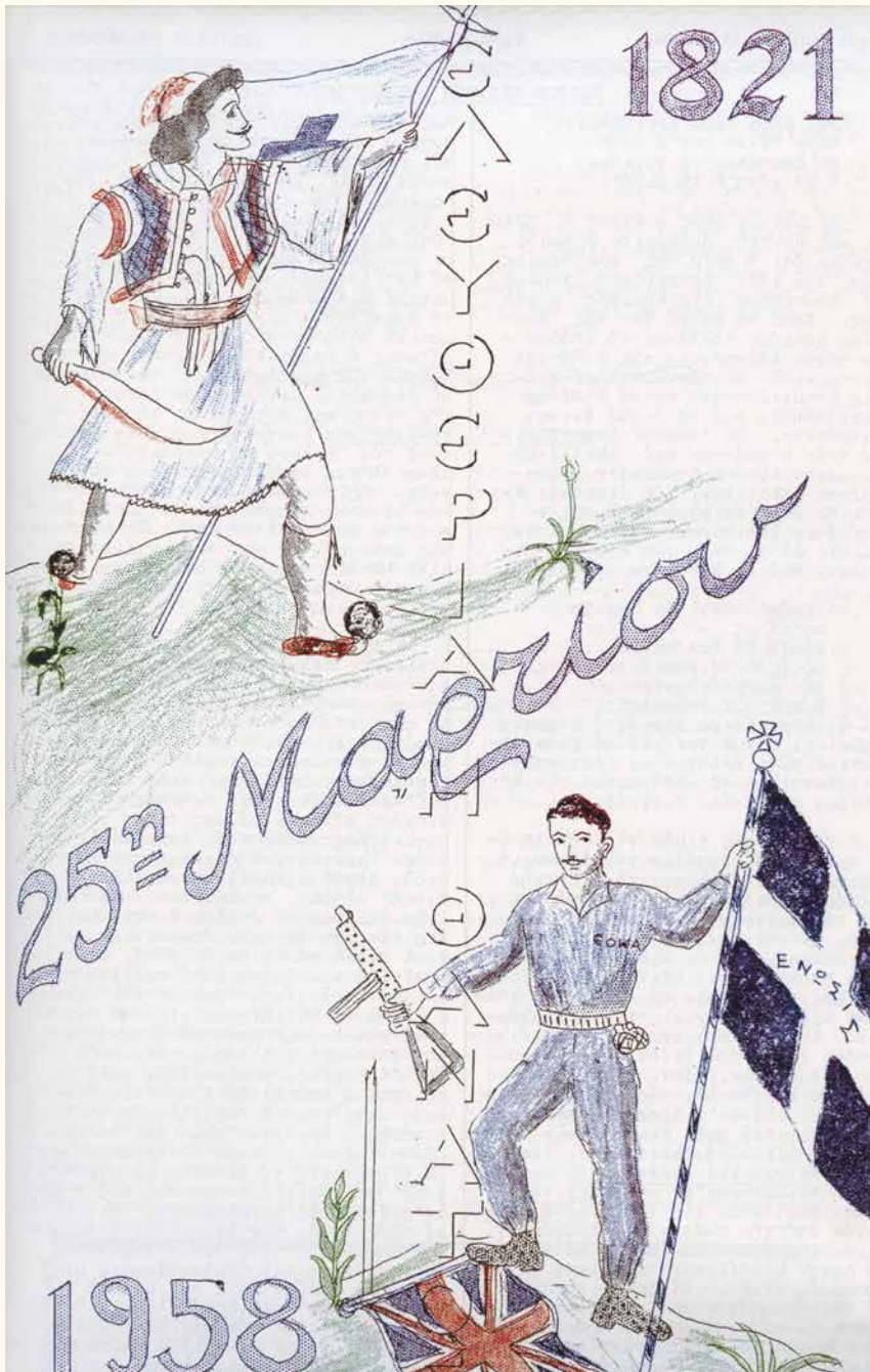
Έγερτήριο Σάλισμα, τχ. 10 (15 Μαρτίου 1958)