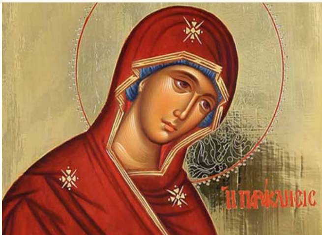
Η ΠΑΝΑΓΙΑ ΜΕ ΤΑ ΤΡΙΑ ΠΑΡΘΕΝΟΣΗΜΑ ΣΤΟΝ ΧΙΤΩΝΑ

Σημειώνουμε ότι το παρακάτω κείμενο της Α' Ὁδῆς αρχίζει με τη λέξη Χαίρε (=έχε χαρά μεγάλη, Παρθένε Μαρία). Αυτή είναι η πρώτη λέξη την οποία απηύθυνε ο Αρχάγγελος Γαβριήλ στην Παρθένο μεταδίδοντας το μήνυμα της σωτηρίας, το οποίο θα επέλθει με τη γέννηση του Σωτήρα Χριστού. Αυτό έχει ιδιαίτερη σημασία, καθώς είναι και η πρώτη λέξη στην ιστορία του Χριστιανισμού. Επομένως ο Χριστιανισμός είναι η Πίστη της Χαράς. Δεν είναι τυχαίο που σε κάθε έκφανση της ζωής μας χρησιμοποιούμε το Χαίρετε (π.χ. είσοδος διδασκάλου στη τάξη, των φιλοξενουμένων στο σπίτι μας κ.λ.π.). Η αληθινή αυτή χαρά σύμφωνα και πάλι με την Ορθόδοξη πίστη μας ἐγκείται στην Χάριν του Θεού που πλημμυρίζει την ψυχή του ανθρώπου με την ουράνια χαρά και φυσικά στη θετική ανταπόκριση του ανθρώπου στη δωρεάν αυτή του Θεού!