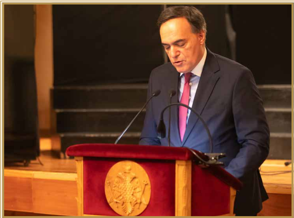
Ο Πρέσβυς κ. Ιωάννης Παπαμελετίου εκφωνεί το κείμενο της ομιλίας του Υπουργού Εθνικής Άμυνας της Ελλάδας κ. Νίκου Δένδια.