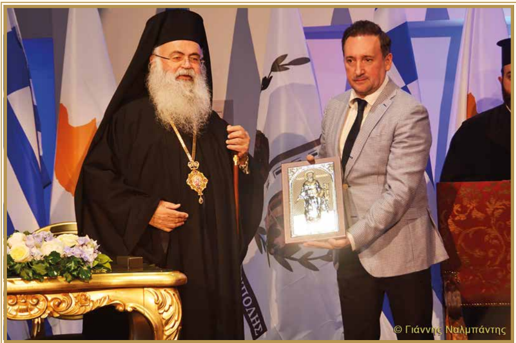
ΑΠΟ ΤΗΝ ΤΕΛΕΤΗ ΑΝΑΓΟΡΕΥΣΗΣ ΤΟΥ ΜΑΚΑΡΙΩΤΑΤΟΥ ΣΕ ΕΠΙΤΙΜΟ ΔΗΜΟΤΗ ΑΛΕΞΑΝΔΡΟΥΠΟΛΕΩΣ

Το βράδυ της Τρίτης, 14 Μαΐου 2024, μέσα σε κλίμα ιδιαίτερης συγκίνησης, αναγορεύτηκε Επίτιμος δημότης Αλεξανδρουπόλεως ο Αρχιεπίσκοπος Κύπρου κ.κ. Γεώργιος , με την ευκαιρία της επισκέψεώς του για τους πάνδημους εορτασμούς των Ελευθερίων της πόλης. Η σεμνή τελετή πραγματοποιήθηκε στον χώρο της ανακαινισμένης ιστορικής « ΑΠΟΘΗΚΗΣ » αρ. 2 στο λιμάνι της πόλεως, σε υλοποίηση της πρόσφατης απόφασης του Δημοτικού Συμβουλίου, μετά από πρόταση του Δημάρχου κ. Ιωάννη Ζαμπούκη.