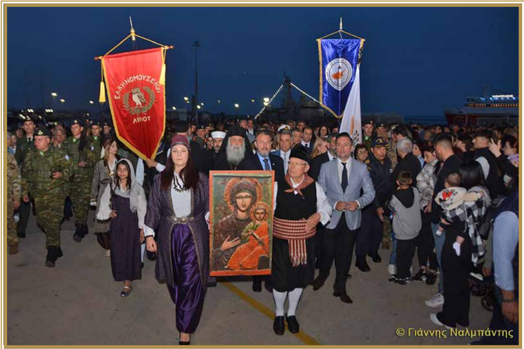
ΑΝΑΠΑΡΑΣΤΑΣΗ ΤΗΣ ΕΛΕΥΣΕΩΣ ΤΗΣ ΕΙΚΟΝΟΣ ΤΗΣ ΠΑΝΑΓΙΑΣ ΤΡΙΦΩΤΙΣΣΗΣ ΑΠΟ ΤΗΝ ΑΙΝΟ ΣΤΟ ΛΙΜΑΝΙ ΤΗΣ ΑΛΕΞΑΝΔΡΟΥΠΟΛΕΩΣ

Ανέφερε χαρακτηριστικά: «Ο ακριτικός τόπος της Θράκης δεν διαφέρει και πολύ από την Κύπρο, όσο και αν τα εξωτερικά δεδομένα φαίνονται ρόδινα: ένας φόβος αβεβαιότητας επιπολάζει μονίμως πάνω από τα κεφάλια του ακριτικού λαού της Θράκης».