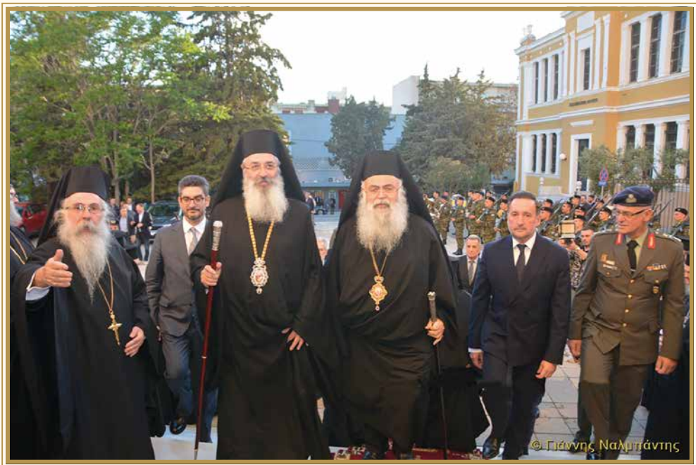
ΑΠΟ ΤΗΝ ΥΠΟΔΟΧΗ ΤΟΥ ΜΑΚΑΡΙΩΤΑΤΟΥ ΣΤΟΝ ΜΗΤΡΟΠΟΛΙΤΙΚΟ ΝΑΟ ΑΓΙΟΥ ΝΙΚΟΛΑΟΥ ΑΛΕΞΑΝΔΡΟΥΠΟΛΕΩΣ

Τον Προκαθήμενο της Κυπριακής Εκκλησίας προσφώνησε ο Σεβασμιώτατος Μητροπολίτης Αλεξανδρουπόλεως κ. Άνθιμος, ο οποίος καλωσόρισε με εγκαρδιότητα τον Αρχιεπίσκοπο Κύπρου, ευχαριστώντας τον για την αποδοχή της πρόσκλησης να τιμήσει με την παρουσία του τους εορτασμούς για τα «ΕΛΕΥΘΕΡΙΑ» της Αλεξανδρούπολης και να επευλογήσει τον ακριτικό λαό της Θράκης και του Έβρου. Ο Σεβασμιώτατος αναφέρθηκε στις ιδιαίτερες σχέσεις Θρακιωτών και Εβριτών με τη μαρτυρική μεγαλόνησο της Κύπρου.