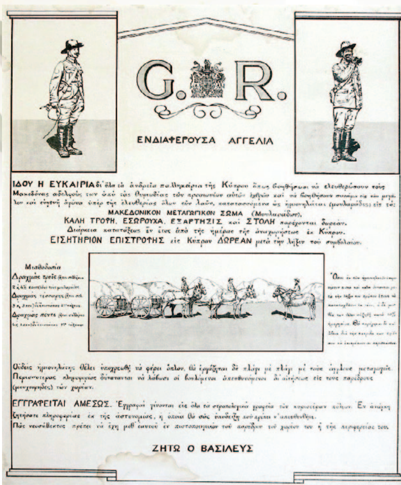
Εικ. 1: Προπαγανδιστική άφίσα για την προσέλκυση Κυπρίων στο Μακεδονικό Μεταγωγικό Σώμα. Η πρωτότυπη βρίσκεται στο Παττίχειο Δημοτικό Μουσείο – Ιστορικό Άρχείο – Κέντρο Μελετών Λεμεσού.

άνδρες οι 110.081 καταγράφη- καν ως Non-Mahomedan (άπό τους όποιους οι 109.219 ως Χριστιανοί Όρθόδοξοι) και οι 29.302 ως Mahomedan . Δηλαδή, οι Κύπριοι ήμωνηγοί ( muleteers ) αντιπροσω-