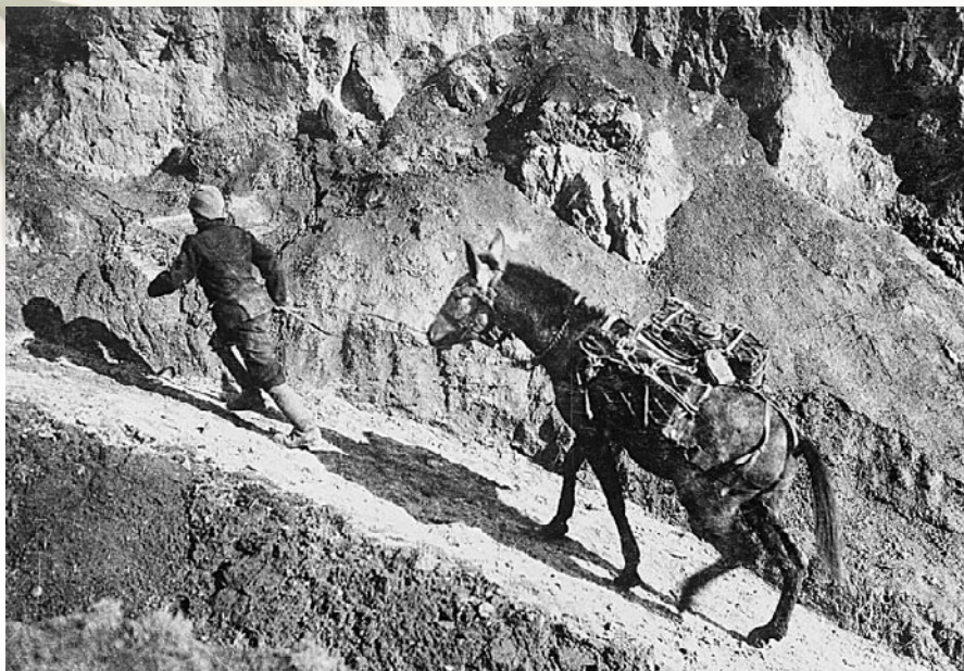
Εικ. 2: Κύπριος ήμιονηγός κουβαλά νερό για τούς πολεμιστές, από μία βαθιά ρεματιά, στό Μακεδονικό Μέτωπο (Γανουάριος 1917).

έθνικων πόθων. Άλλωστε, διακαής πόθος εκατοντάδων Κυπρίων και αίτημα του ίδιου του Έλευθερίου Βενιζέλου ήταν ή στρατολόγηση για τόν στρατό τής Έθνικης Άμυνας. 5