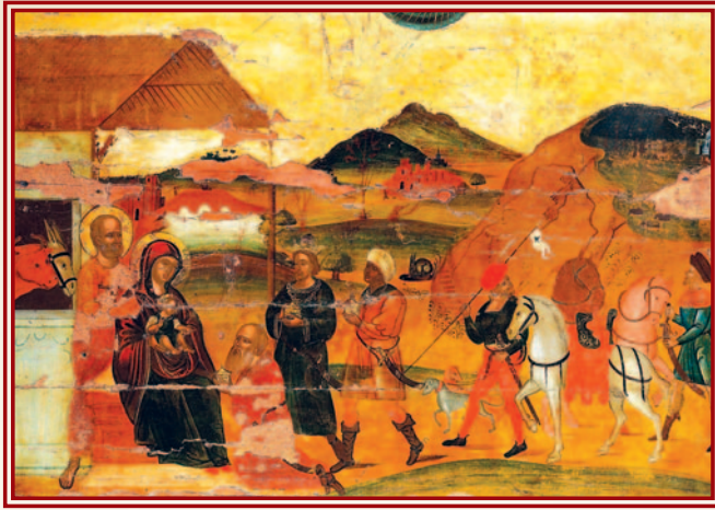
Ἡ προσκύνηση τῶν Μάγων. Μουσεῖο Βυζαντινοῦ Πολιτισμοῦ Θεσσαλονίκης.