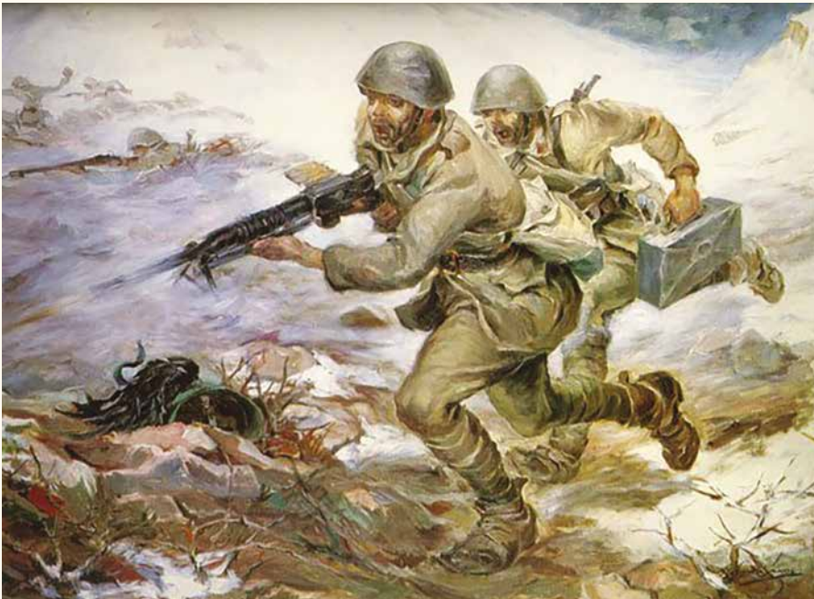
ΠΙΝΑΚΑΣ ΤΟΥ ΑΛΕΞΑΝΔΡΟΥ ΑΛΕΞΑΝΔΡΑΚΗ ΜΕ ΤΙΤΛΟ "ΠΡΟΕΛΑΣΙΣ"

Μετά την πανηγυρική Δοξολογία, ακολούθησε εντυπωσιακή μαθητική παρέλαση στην οδό Βύρωνος, όπου βρίσκεται η Ελληνική Πρεσβεία, μπροστά από τους επισήμους. Τα νιάτα της Πατρίδας μας μάς συγκίνησαν και πάλιν και οι ψυχές μας ανατροφοδοτήθηκαν από τη σοφή προτροπή των προγόνων μας: «θαρσεῖν χρή, τάχ' αὔριον ἔσεται ἄμεινον».