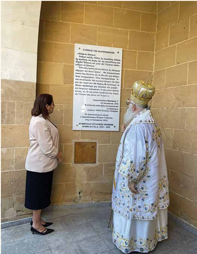
Ο ΑΡΧΙΕΠΙΣΚΟΠΟΣ ΚΥΠΡΟΥ κ. κ. ΓΕΩΡΓΙΟΣ ΚΑΙ Η ΥΠΟΥΡΓΟΣ ΠΑΙΔΕΙΑΣ κ. ΑΘΗΝΑ ΜΙΧΑΗΛΙΔΟΥ ΜΠΡΟΣΤΑ ΑΠΟ ΤΗΝ ΠΛΑΚΑ ΤΟΥ ΟΡΚΟΥ ΤΗΣ ΦΑΝΕΡΩΜΕΝΗΣ

Ακολούθησε η κατάθεση στεφάνων και όλη εθνοπρεπής τελετή έληξε με τον Εθνικό Ύμνο.